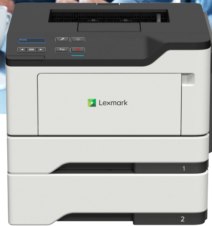
MS421dn con bandeja opcional

Confiabilidad. Seguridad. Productividad.