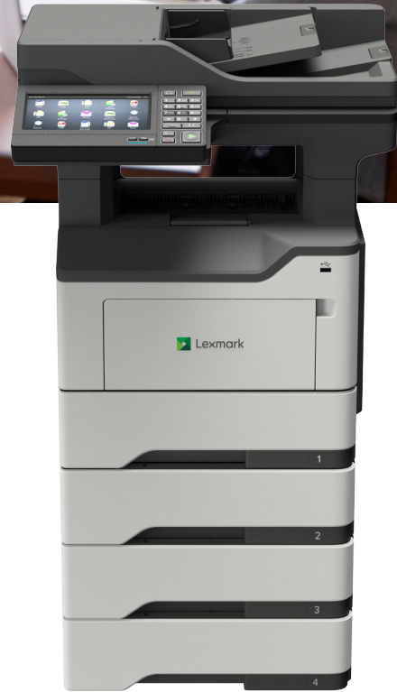
MX622adhe con bandejas opcionales

Confiabilidad. Seguridad. Productividad.